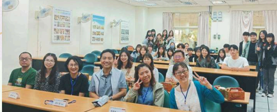
財金學程校友回娘家！ 校友們皆在各方深耕有成 回歸系上心得分享交流