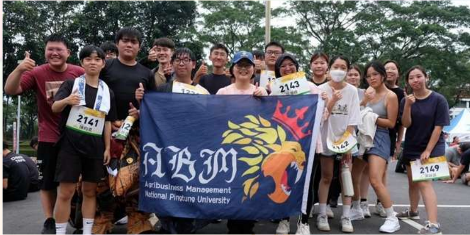
農企系上活躍參與校慶上各式運動賽事，活力滿滿