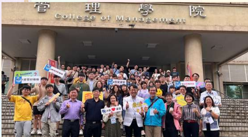
資管系校友回娘家 冠蓋雲集！